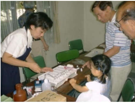
カプセルに試薬を注ぎNO 2 濃度を測る

図-2はNO 2 濃度の月別平均値の推移で、車の交通量の多い佐須街道・武蔵野市場横と調布ヶ丘3-39Tマンション角、車の少ない布田天神角と深大寺元町・池上院坂下の4カ所の測定結果です。比較のために甲州街道下石原交差点の交番裏での測定値(これは調布市の測定値)も示しました。