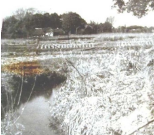
1941年(昭和16年)頃の佐須と調布ヶ丘の田んぼ