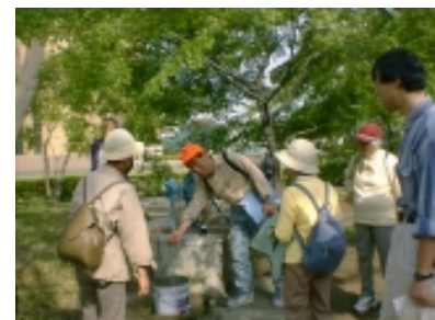
白百合女子大の井戸