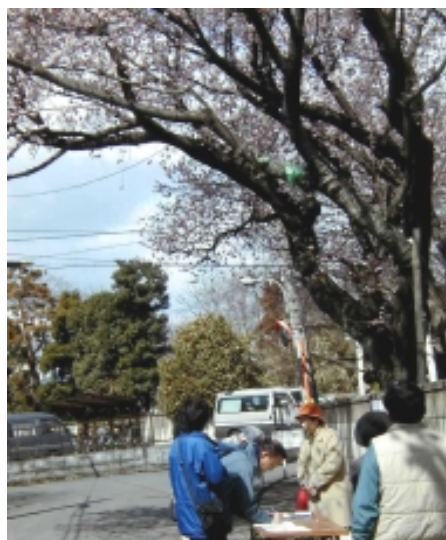
オオカンザクラの下の署名風景。まち会メンバーも署名集めに協力した。

署名は要望書とともに、4月11日、調布市長に提出。調布市も、「樹木が痛まないよう協力し、約束の実現を注意深く見守る」とのことです。市民が声を出すって、大事ですね。(矢嶋)