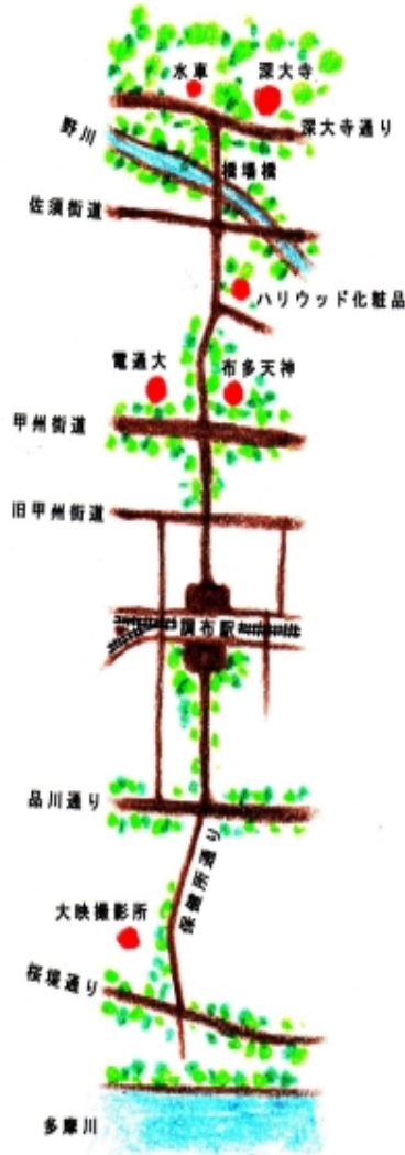
図 - 1