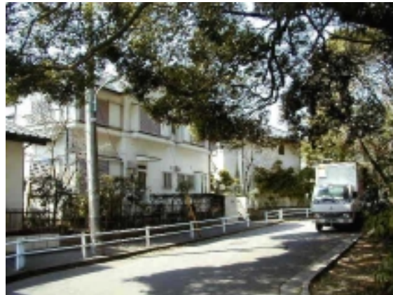
現在の風景(2000年3月、虎狛神社裏にて)

写真募集 調布の昔の 写真を探し ています。お 持ちの方は 調布まちづ くりの会ま でご連絡く ださい。