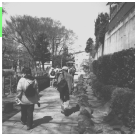
布田崖線下の“染地せせらぎの散歩道”は水路を暗渠にして整備されたもの。

4/23 仙川周辺（第2回） 6/3 野川～深大寺（第3回） 7/8 東京スタジアム周辺（第4回）