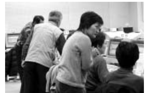
フォローアップ講習には大勢のボランティアが参加